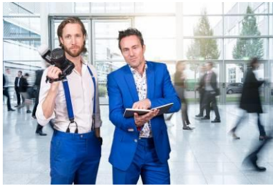
Razende reporters op locatie