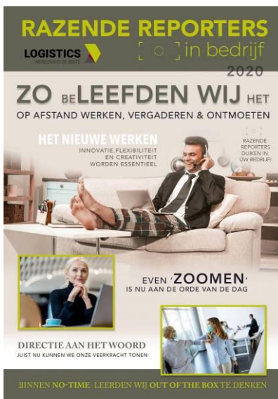
Voorbeeld cover magazine

Het management kan een zakelijke boodschap meegeven. Of misschien is een compliment over de flexibele acceptatie, harde werken, etc. van de werknemers over het nieuwe nu op z'n plaats. De razende reporters interviewen het management of de directeur op een luchtige en leuke manier.